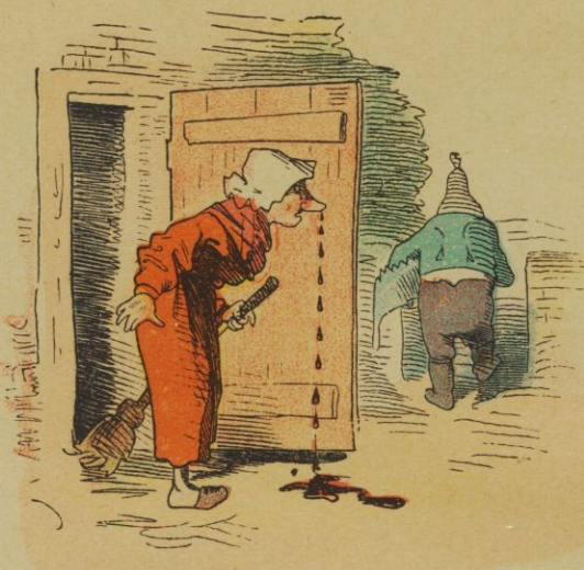
Die Nase blutet fürchterlich, Der Bauer denkt: „Was kümmert's mich?“