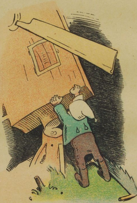
Racksnack! Da bricht die Mühle schon, Das war des bösen Müllers Lohn.