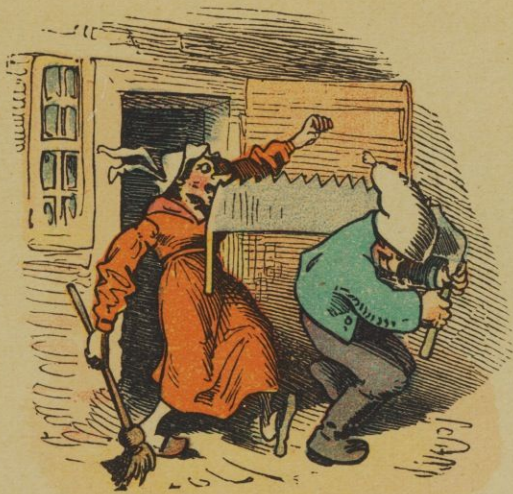
Ein Sägezahn trifft ganz genau Ins Nasenloch der Bauersfrau.